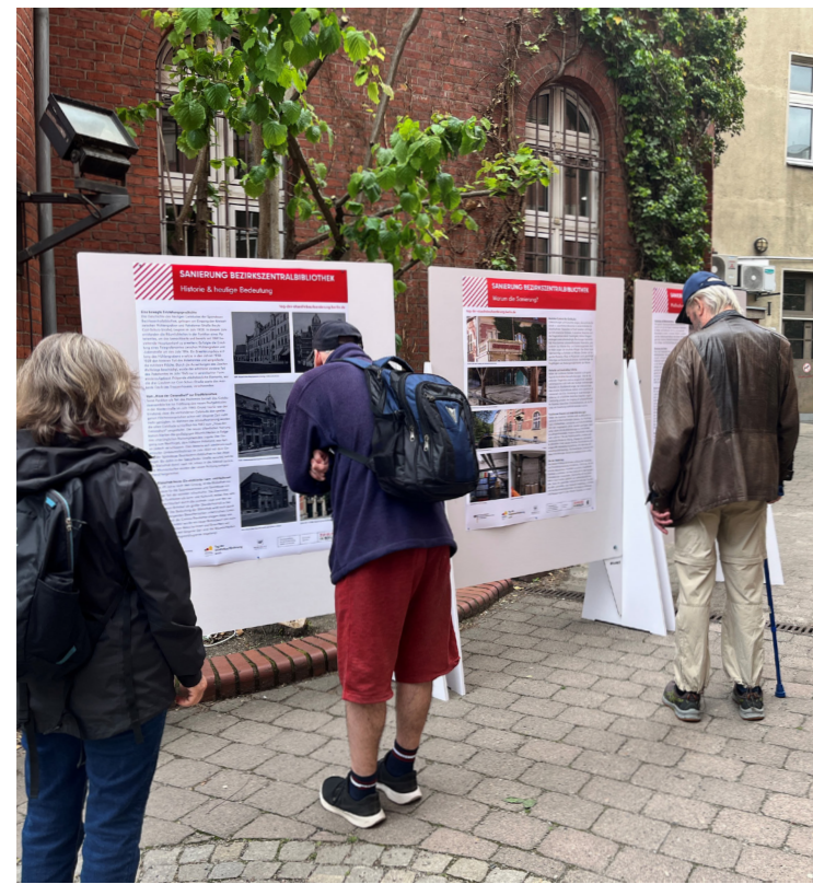
Im Hof der Bezirkszentralbibliothek Spandau erfuhren die Besucherinnen und Besucher, wie das Gebäude saniert und für die Zukunft fit gemacht wird.

Informationen, Gespräche und Perspektiven zur Zukunft der Bezirkszentralbibliothek