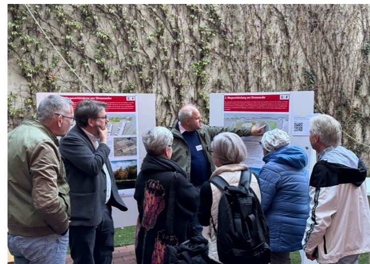
Im direkten Gespräch mit Fachleuten konnten sich die Teilnehmenden über aktuelle Vorhaben informieren und eigene Anregungen einbringen.

Wir bedanken uns herzlich bei allen Teilnehmenden für das große Interesse, die konstruktiven Beiträge und den engagierten Austausch und freuen uns darauf, die Entwicklung der Altstadt weiterhin gemeinsam zu gestalten.