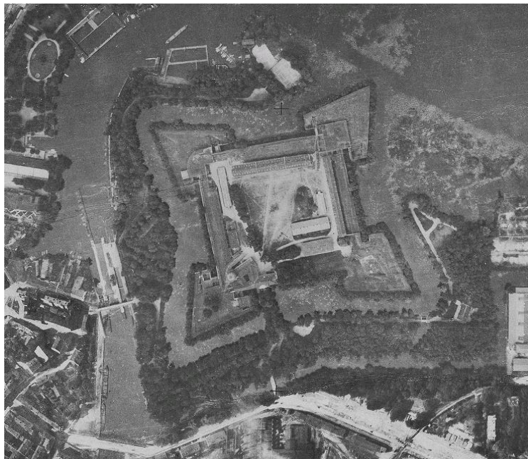
Luftbild der Zitadelle 1928

„...Bedauerlicherweise wurde bei der Herrichtung die Eigenart des Glacis, das mit seinen leichten Wallerhebungen den anderen Parks gegenüber einen recht eigentümlichen Charakter aufwies, fast vollkommen verwischt...“ (aus Ludewig o.J.: 191)