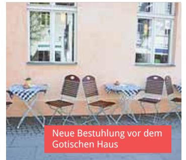
Neue Bestuhlung vor dem Gotischen Haus