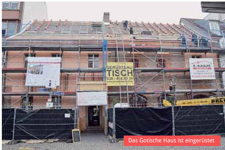
Das Gotische Haus ist eingerüstet

„Oben ohne“ präsentiert sich derzeit das Gotische Haus in der Breite Straße. Mitte Oktober haben die Arbeiten zur Erneuerung des Daches begonnen und sollen gegen Ende des Jahres abgeschlossen sein. Das Dach wies an mehreren Stellen Undichtigkeiten auf, so dass es bereits zu ersten Wasserschäden im Gebäude gekom-