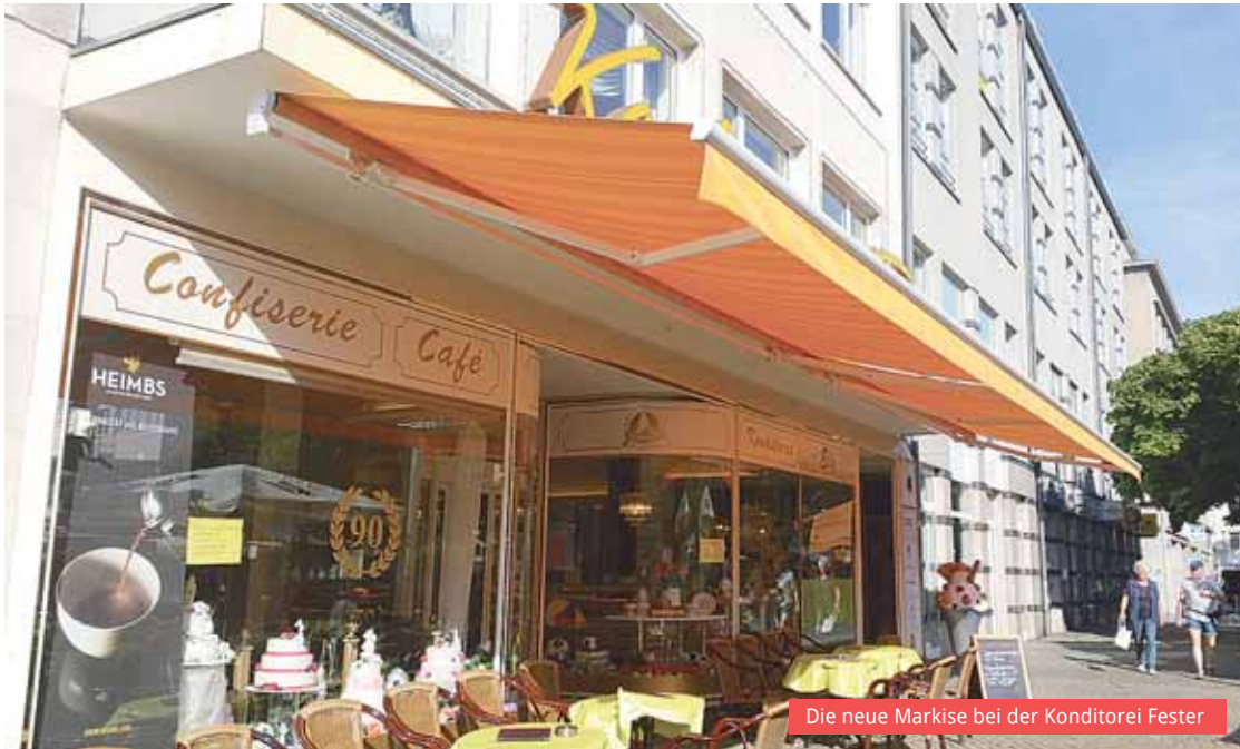
Die neue Markise bei der Konditorei Fester

Unterstützung von Projekten in der Altstadt