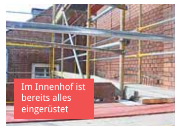
Im Innenhof ist bereits alles eingerüstet