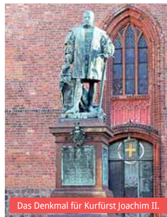
Das Denkmal für Kurfürst Joachim II.

Am südöstlichen Zugang zum Reformationsplatz – an der Mönchstraße – soll eine neue Rampenanlage entstehen, die den Anforderungen der Barrierefreiheit entspricht und den