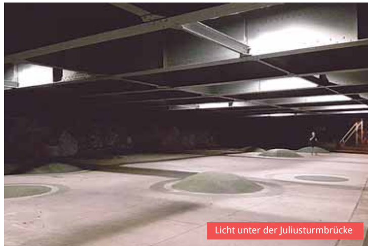
Licht unter der Juliusturmbrücke

Es werde Licht! Pünktlich zu Beginn der dunklen Jahreszeit konnte die neue Beleuchtung unter der Juliusturmbrücke fertiggestellt und in Betrieb genommen werden. Die Uferpromenade entlang der Altstadt wird bei Dunkelheit von Laternen erhellt. Der Bereich unter der Brücke war davon jedoch bislang