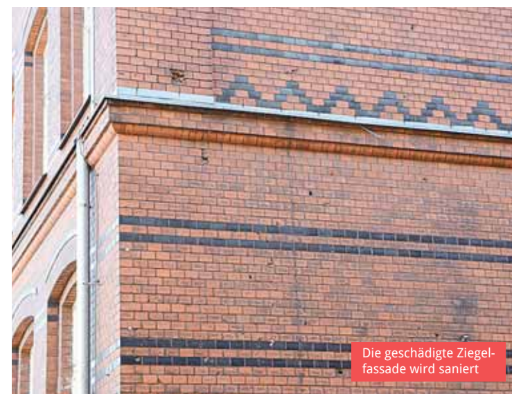
Die geschädigte Ziegelfassade wird saniert