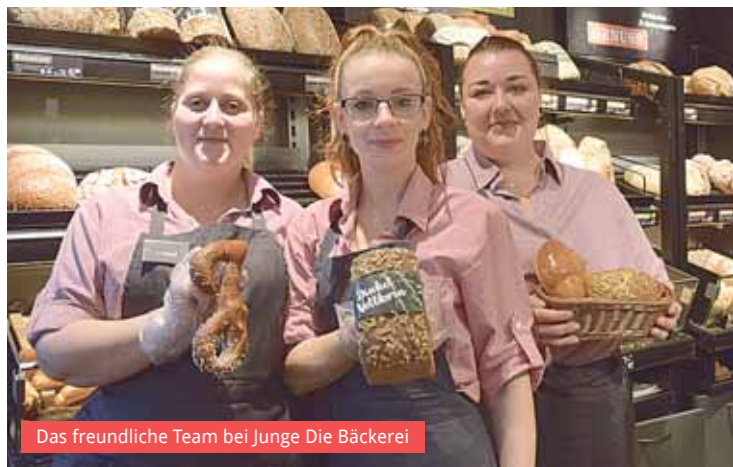
Das freundliche Team bei Junge Die Bäckerei

Verfügung steht, oder aus einem der Frühstücksangebote zu wählen – in dem außergewöhnlich und ansprechend eingerichteten Café fühlen sich die Gäste wie zuhause und be-