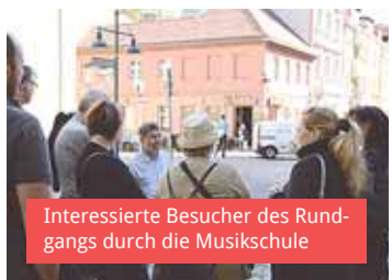
Interessierte Besucher des Rundgangs durch die Musikschule