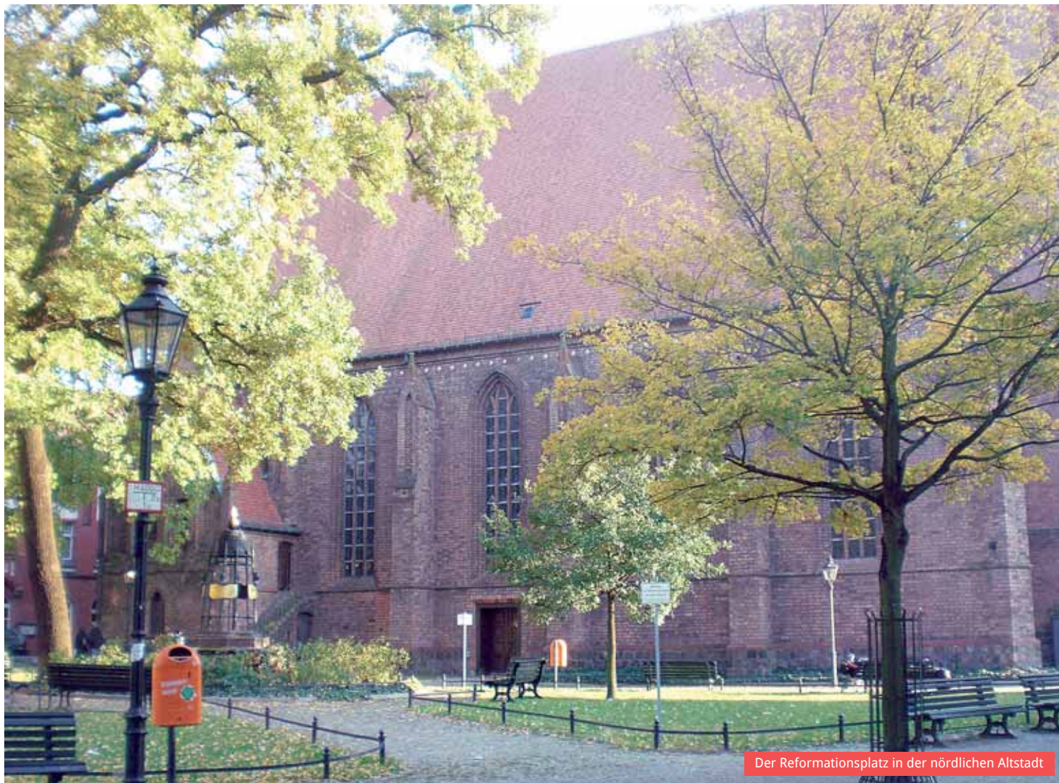
Der Reformationsplatz in der nördlichen Altstadt