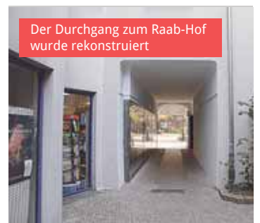
Der Durchgang zum Raab-Hof wurde rekonstruiert

auf und verweist auf die Fördermittel für das Jahr 2019, die der Altstadt zur Verfügung stehen.