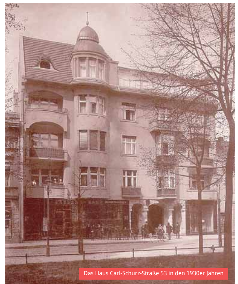
Das Haus Carl-Schurz-Straße 53 in den 1930er Jahren

Der Hof soll zukünftig ebenfalls einladender wirken und für die Altstadtbesucher besser sichtbar sein.